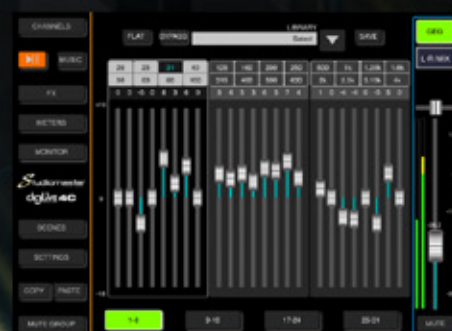
GRÁFICO DE 31 BANDAS EN LAS SALIDAS DE MEZCLA PRINCIPAL L/R FÁCIL DE USAR Y GUARDAR EN SU BIBLIOTECA CONTROL TOTAL SOBRE SU MEZCLA (TOQUE DOS VECES EL CONTROL PARA CENTRAR EL FADER)

ECUALIZADOR PARAMÉTRICO DE 4 BANDAS HPF Y OPERACIÓN INTUITIVA GUARDAR EQ EN PRESETS (EL MODO BÁSICO CONVIERTE EL EQ A 4 BANDAS FIJAS)